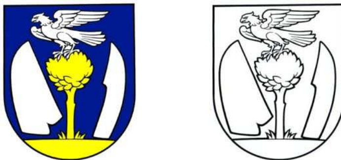
Obr. 1 Erb obce Šarišské Sokolovce

Symboly obce tvoria – erb, vlajka a pečať. Sokoliarmi boli iba najstarší obyvatelia obce Šarišské Sokolovce. Ich potomkovia sa zaoberali poľnohospodárstvom a pracovali v lesoch. Všetky tieto zdroje obživy sa uplatnili aj v historickom znaku obce. V pečatidle z roku 1786 z pažite vyrastá strom, na vrchole jeho koruny stojí sokol. Po stranách stromu je kolmo postavený obrovský lemeš s čerieslom, ktorý akoby vyjadroval, že v obci v čase vzniku pečatidla prevládalo poľnohospodárstvo.